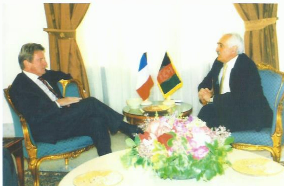
دیدار با برنارد کوشنر، وزیر خارجه‌ی فرانسه، کابل.