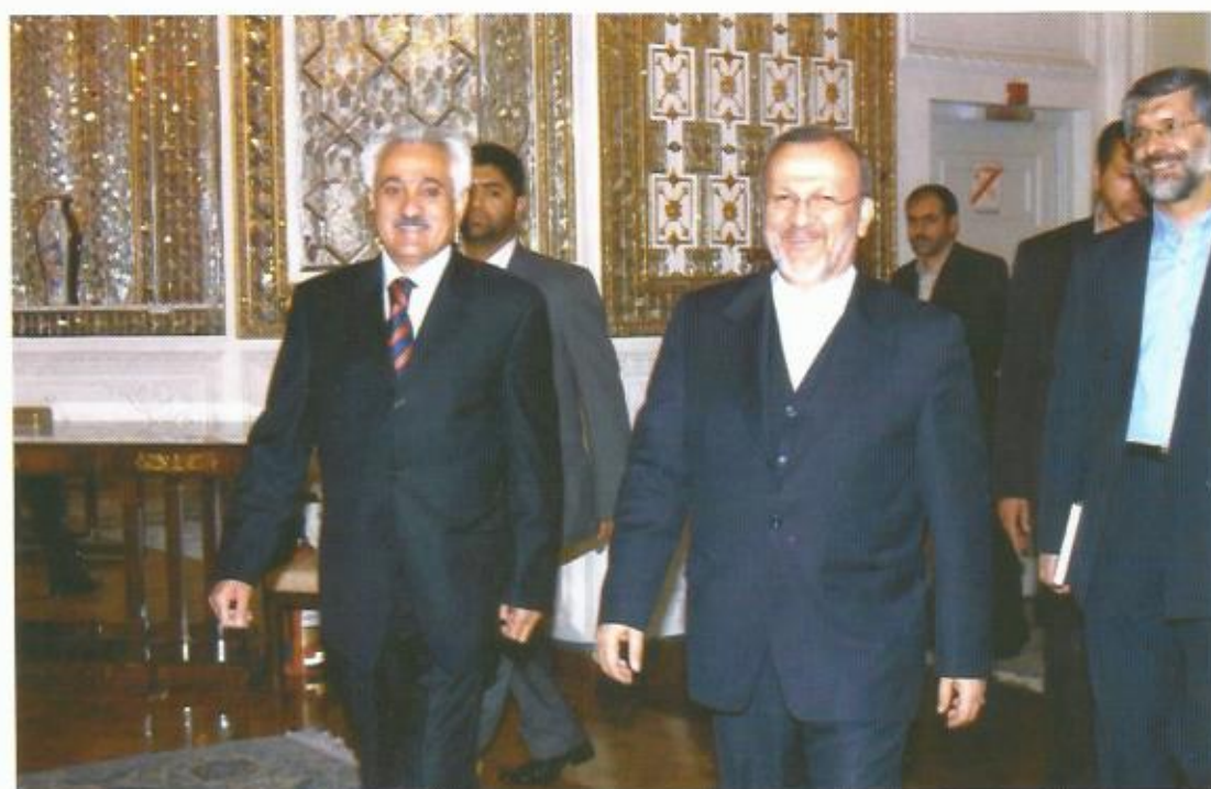
دیدار با منوچهر متکی، وزیر خارجه‌ی جمهوری اسلامی ایران،