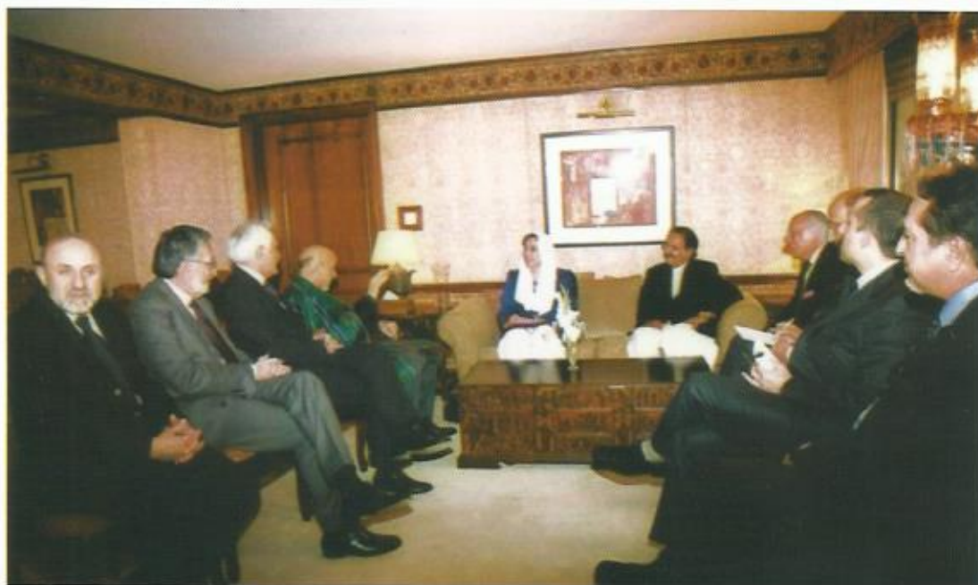
دیدار با خانم بینظیر بوتو، هتل سرینا، اسلام آباد، پاکستان، ۲۰۰۷. (بینظیر بوتو دو سه ساعت پس از این ملاقات کشته شد.)