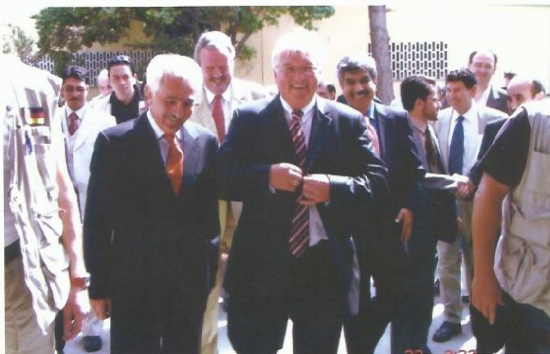
دیدار با فرانک اشتاین مایر وزیر خارجه‌ی پیشین و رئیس جمهور کنونی آلمان، ۲۰۰۷.