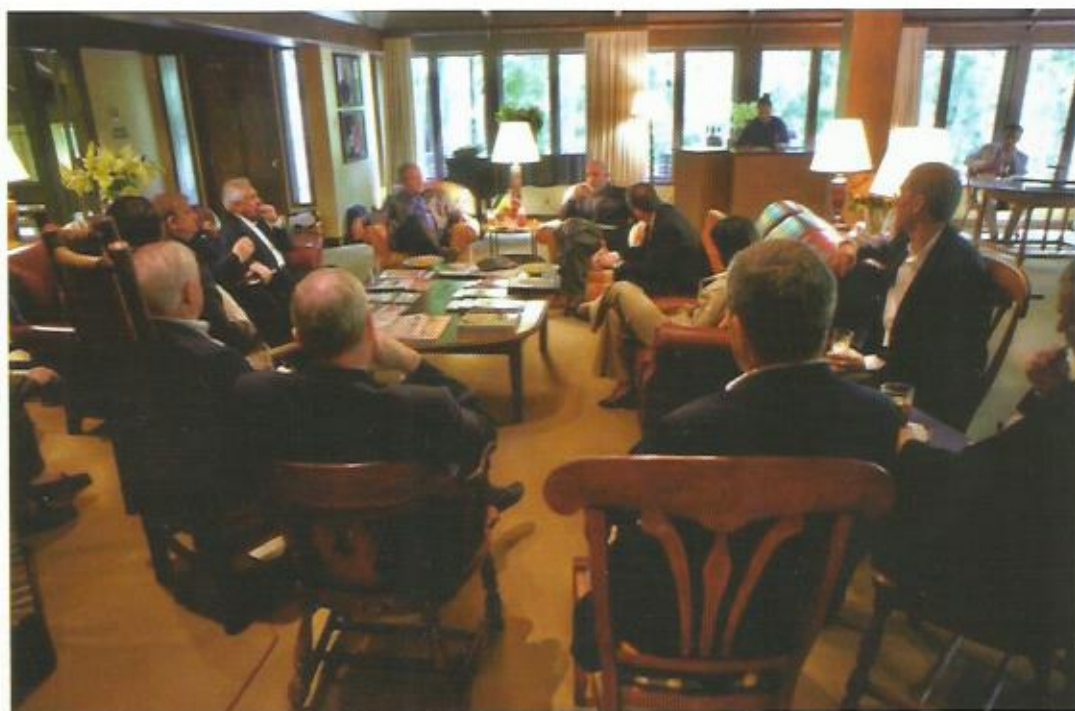
ملاقات کمپ دیوید، ایالات متحده آمریکا، ۲۰۰۸.