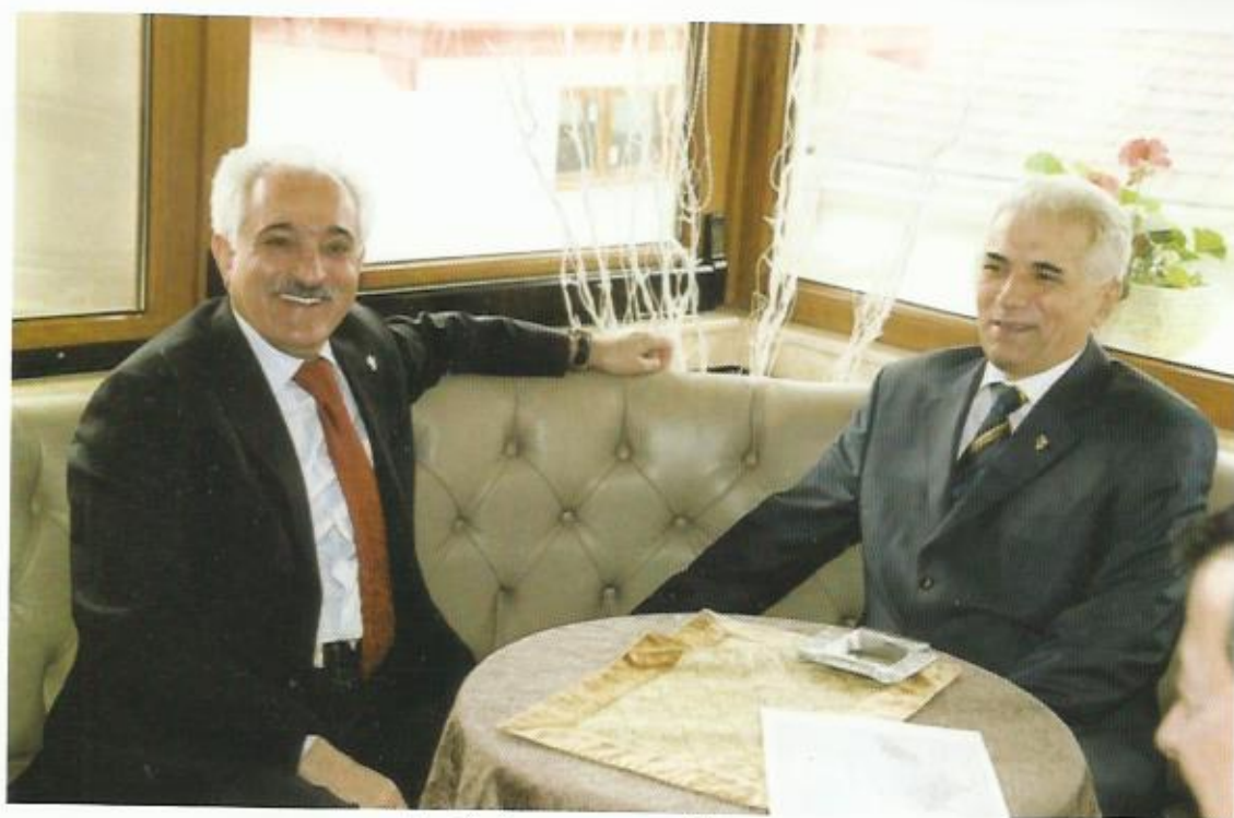
دیدار با همراه خان ظریفی وزیر خارجه‌ی تاجکستان، دوشنبه، تاجکستان،