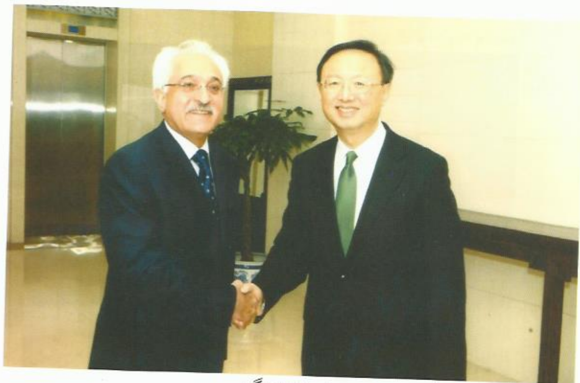
دیدار با یانگیشی، وزیر خارجه‌ی جمهوری مردم چین، بیجنگ.