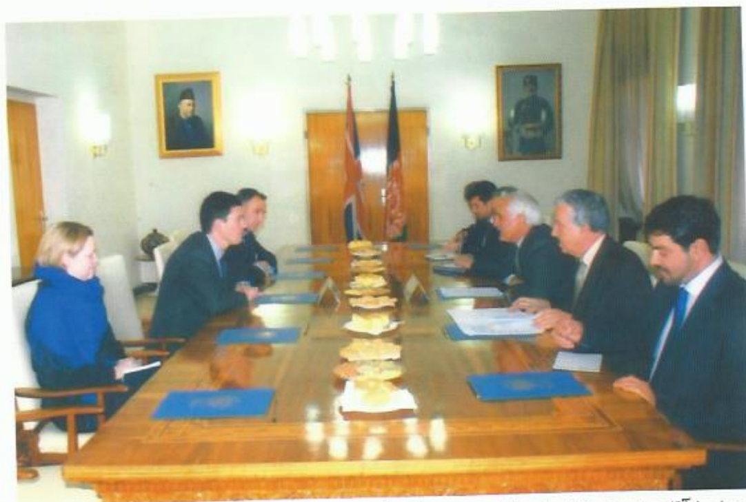
دیدار با آقای دیوید میلبند وزیر خارجه‌ی بریتانیا، کابل، ۲۰۰۸.