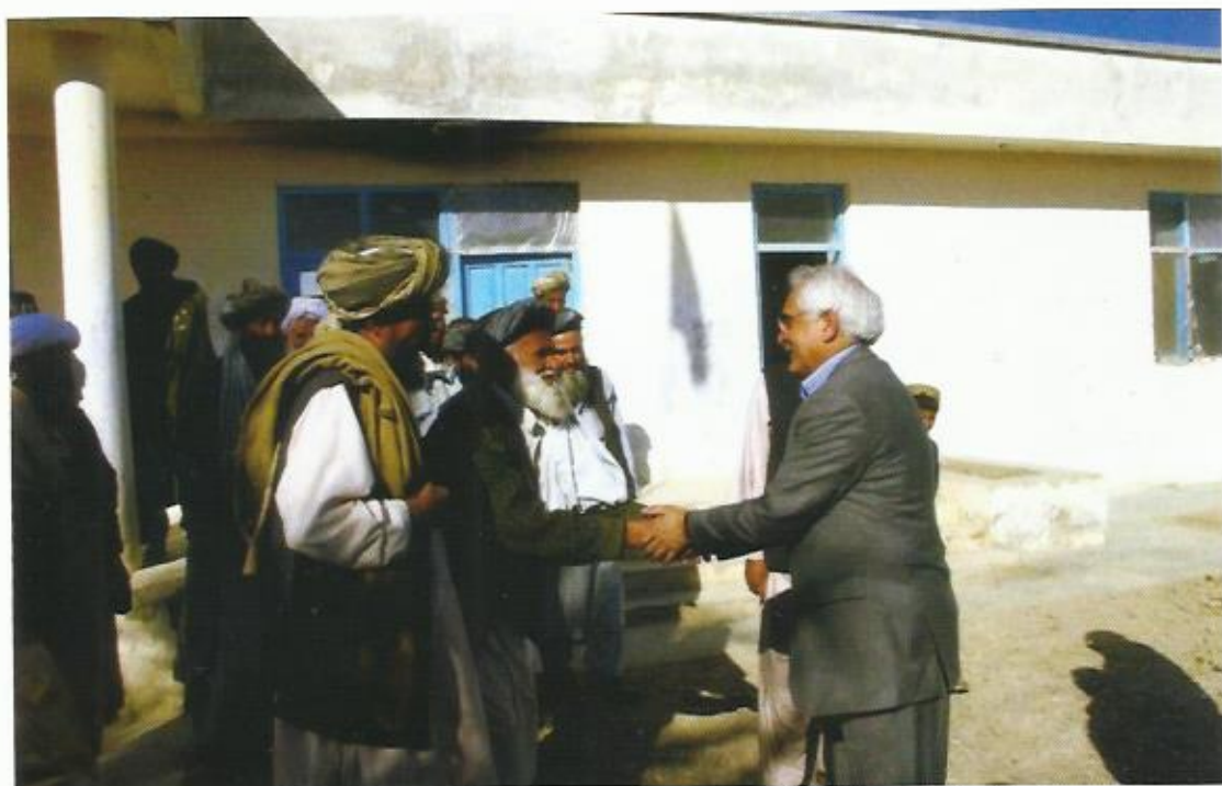
مصافحه با مردم، ولسوالی گرمسیر، ولایت هلمند، ۲۰۰۷.