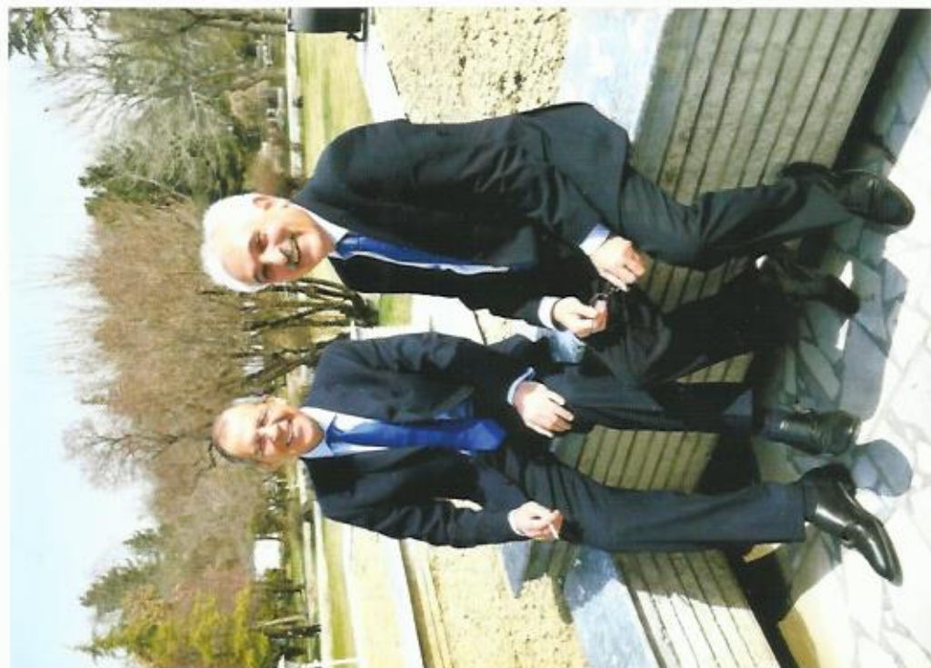
با سرگی لاوروف وزیر خارجه‌ی فدراتیف روسیه، وزارت خارجه افغانستان، ۲۰۰۸.