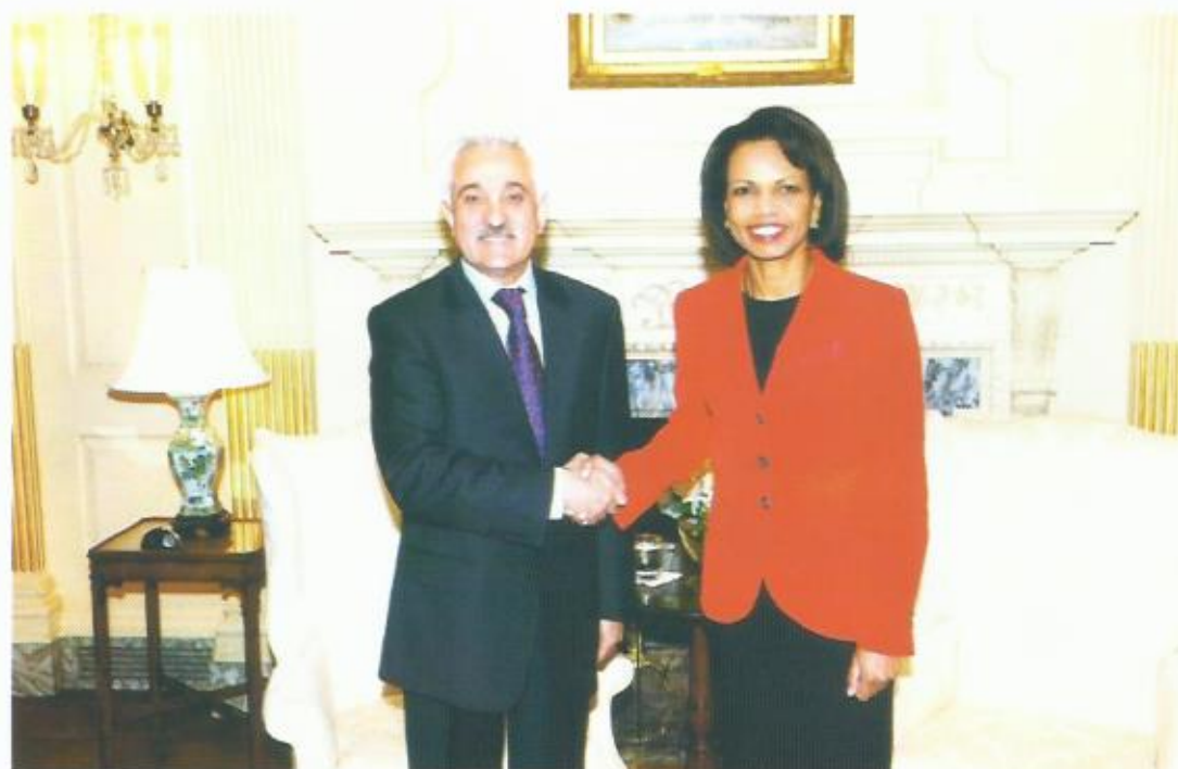
دیدار با خانم کاندولیزا رایس، وزیر خارجه‌ی ایالات متحده امریکا، واشنگتن.