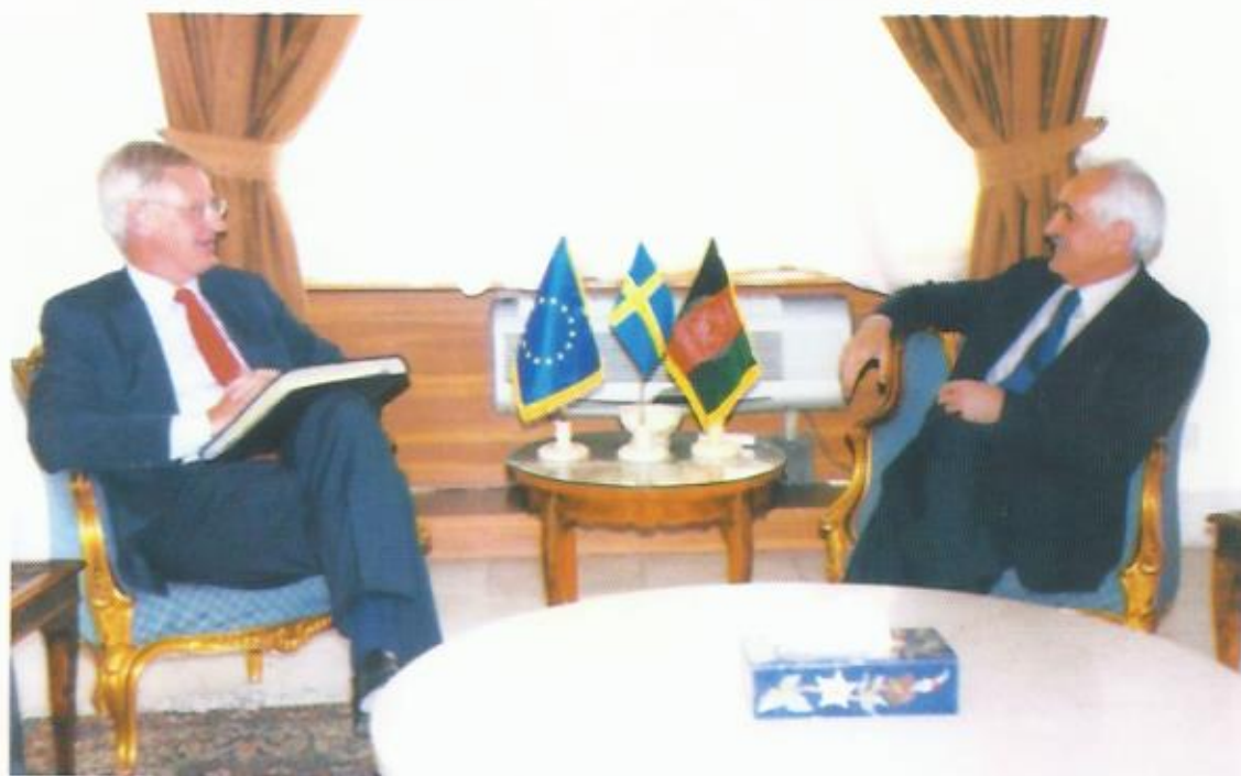
دیدار با کارل بریل، وزیر خارجه‌ی کشور شاهی سویدن، کابل.