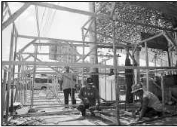
KIOS DARURAT—Sejumlah pekerja membuat kerangka sebagai kios darurat di Pasar Ayu Solo, Rabu (15/9). Hal itu terkait segera dimulainya revitalisasi pasar tersebut

"Warga Solo kamiimbau mengatur waktu balik, jangan terfokus pada hari Sabtu dan Minggu ini," tandas dia. ■ kur