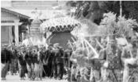
NGUSUNG GUNUNGAN—Para prajurit Karaton Kasunanan Surakarta ngusung gunung tumuju Masjid Agung, sawetara wektu kapungkur.