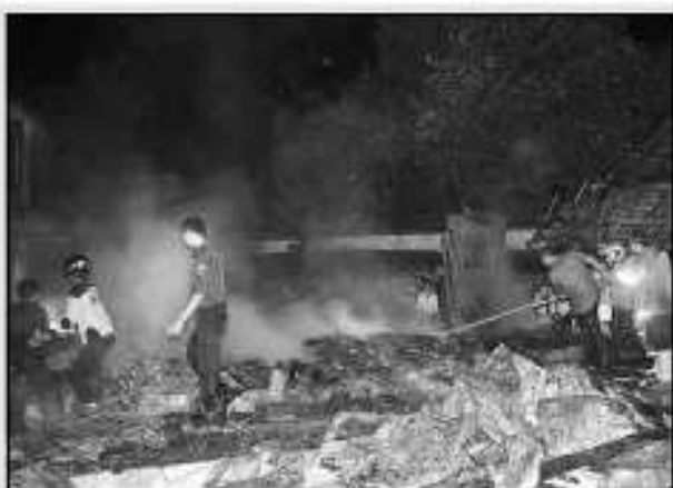
PEMADAM API—Petugas pemadam kebakaran memadamkan sisa api yang menghancurkan 4 lor Pasir Tuban, Gondangrejo, Karanganyar, Rabu (15/9) malam. Api berhasil dikuasai petugas sehingga tidak merambat ke tempat lain.