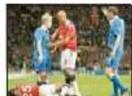
CEDERA PARAH—Pemain Manchester United Antonio Valencia (bawah) mengalami cedera dalam laga kontra Rangers di Old Trafford, Rabu (15/9) dini hari WIB.

Menyadari tekanya berakibat sangat fatal, Broadfoot terlihat ketakutan. Ia pun langsung memanggil tim dokter untuk menolong Valencia yang hanya bisa mengerang kesakitan. Yms