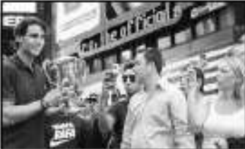
SAPA PENGEMAR—Rafael Nadal, kampiun US Open 2010 memamerkan trofi yang baru saja dimenangkan kepada para penggemarnya di Times Square, New York, Selasa (14/9) waktu setempat.

"Saya tak tahu (kesuksesan) saya sekuat dengan (kesuksesan) juara olahraga Spanyol tahun ini. Mereka semua sangat penting. Untungnya, kami hidup di era olahraga Spanyol yang akan sulit diulangi. Tentu saja kami ingin mengulanginya, namun kami seharusnya menikmati apa yang ada saat ini." J anh