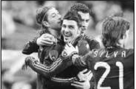
SPANYOL TERATAS—Pasukan La Furia Roja masih berada di peringkat pertama daftar peringkat dunia versi FIFA yang dirilis pada Rabu (15/9).