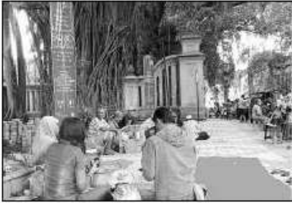
PKL—Puluhan PKL memadai Jl Pakubuwono, Gladak, semenjak Lebaran hingga sekarang. Paving yang baru saja diganti dimanfaatkan oleh mereka untuk tempat dhasaran, Rabu (15/9).

Delapan KK penerima bantuan relokasi itu tercatat sebagai warga Pucangawit. Dengan lokasi penggantian tanah mereka berada di Mipitan, Mojoagung. "Saya cek di Mipitan, Mojoagung, tersedia 10 kavling. Warga di sana, menjelaskan dua kavling sedang dipertajam, dan satu lagi," ujarnya. aps