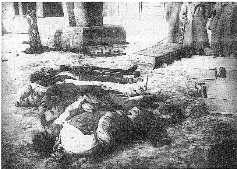
Погибшие участники подавления мятежа. 4-3101.

27/II с.г. делегаты вернулись на свои корабли и доложили общим собраниям команд о причинах волнений на заводах: Балтийском, трубочном, линкорах "Гангуте" и "Полтаве", стоявших на Неве; положение в Петербурге было изображено ими в сгущенных красках; было доложено о массовых арестах бастующих рабочих и прочитана контрреволюционная резолюция рабочих Балтийского завода. В результате этих докладов собранием команды "Петропавловска" была 28/II принята известная резолюция из 13 пунктов, разрабо-