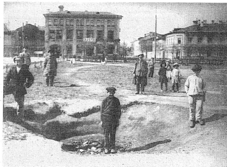
Воронка от снаряда на площади в Кронштадте. 4-3153.