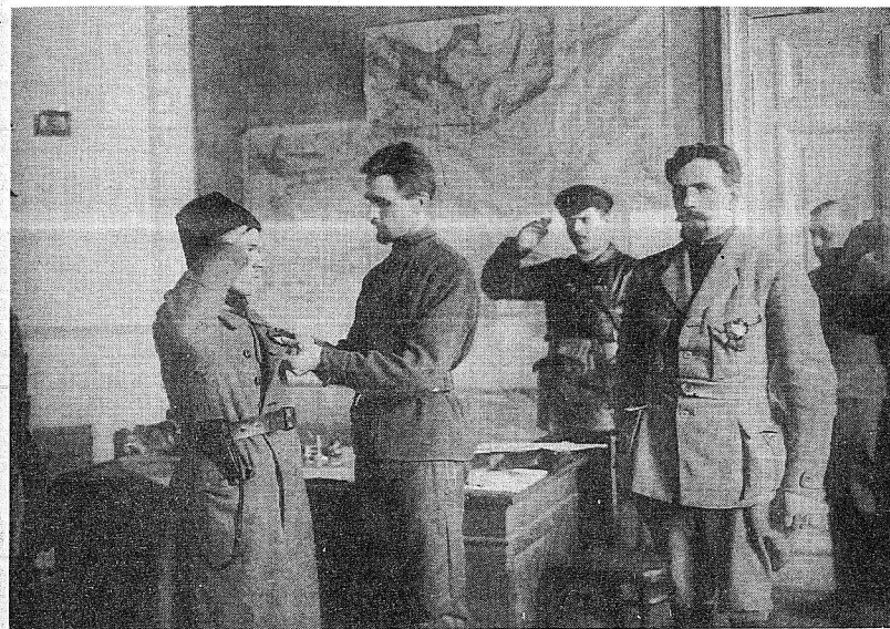
Командующий Южной группой войск А.И.Седякин награждает участника подавления мятежа орденом Красного Знамени. Справа — П.Е.Дыбенко. 4-3141.