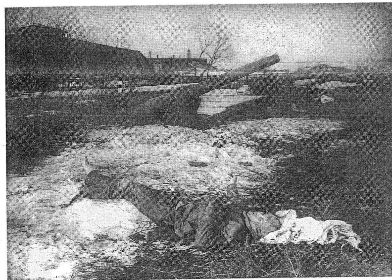
Тяжелое артиллерийское орудие на боевой позиции. 4-3096.