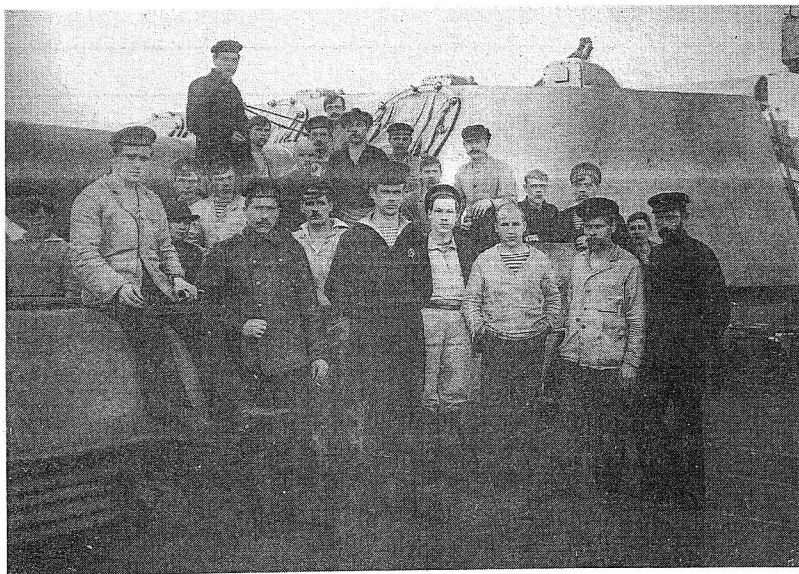
Группа матросов с линкора "Севастополь", участвовавшая в подавлении мятежа. 4-3164.

На упомянутом делегатском собрании Петриченко в своем докладе о военном и политическом положении подчеркнул полную боевую готовность всего гарнизона крепости и кораблей. Собрание постановило поголовно вооружить всех рабочих Кронштадта и поручить им внутреннюю охрану города.