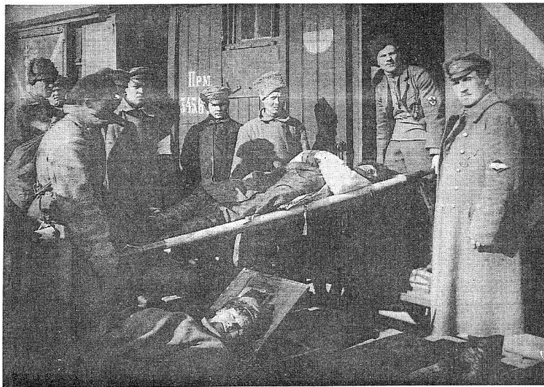
Погрузка раненых солдат в санитарный вагон. Ораниенбаум. 4-3078.

Разделение организации на разные группировки и оттенки мнений при данных условиях неизбежно должно было привести к распаду организации. Рядовые члены партии, политическое сознание которых ничем не возвышалось над уровнем сознания беспартийной массы матросов и рабочих, вносили в эту массу весь тот идейный разброд, который разъедал коммунистическую организацию, и тем еще более способствовали отмежеванию пролетарской и полупролетарской массы от коммунистической партии, в которой она начала видеть якобы виновника общей разрухи.