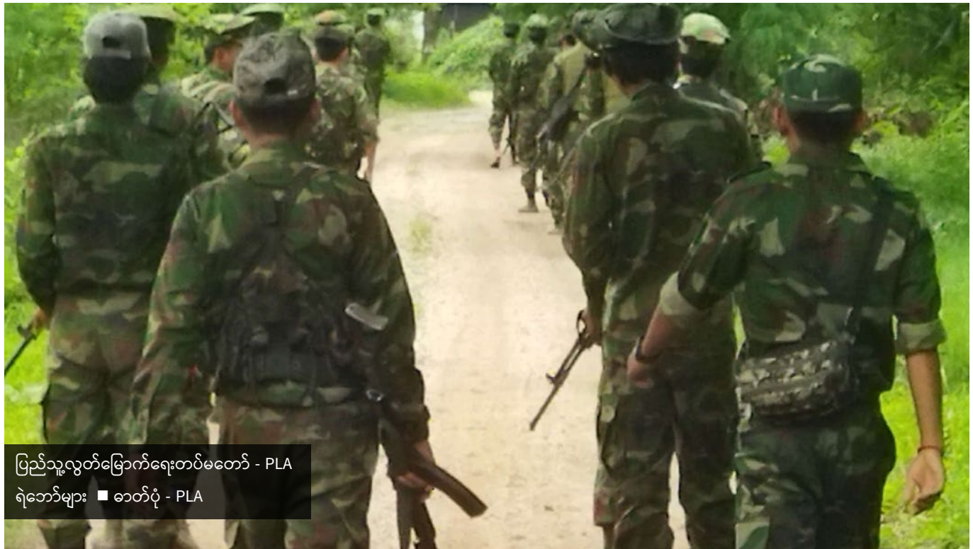
ပြည်သူ့လွတ်မြောက်ရေးတပ်မတော် - PLA ရဲဘော်များ ■ ဓာတ်ပုံ - PLA

တယ်။ PDF-LDF တွေကို ပျက်ရယ်ပြုချင်ကြတယ်။ အလယ်အလတ်ဂိုဏ်းတွေကတော့ အတော် လေးရှုပ်ထွေးတယ်။ ၂၀၁၀ နောက်ပိုင်း NCA တစ်နိုင် င်လုံး အပစ်ရပ်စာချုပ်ဖြစ်မြောက်ရေးတွေ ၂၁ ရာစု ပင်လုံညီလာခံတွေ၊ ရွေးကောက်ပွဲတွေ စည်ကားလာ တော့ တိုင်းရင်းသားတွေထဲမှာ Identity Politics တွေ ခေတ်စားပြီး နိုင်ငံရေးပါတီတွေ တသိကြီးထောင် လာကြတယ်။ လူမျိုးစုငယ်ငယ်လေးကလဲ သူ့ဒေသ အလိုက်နိုင်ငံရေးအခွင့်အာဏာကို စဉ်းစားလာကြပြီး တိုင်းရင်းသားတွေ အကြား စည်းလုံးမှုပိုမိုပျက်ပြားလာ တယ်။ ၂၀၁၀ ရွေးကောက်ပွဲမှာ ဝင်ပြိုင်ဖို့ မှတ်ပုံတင် တဲ့ပါတီ ၉၇ ပါတီရှိတဲ့ အထဲမှာ တိုင်းရင်းသားပါတီ ၄၇ ပါတီရှိနေတယ်။ ၂၀၁၅ ရွေးကောက်ပွဲရောက် တော့ မှတ်ပုံတင်ထားတဲ့ တိုင်းရင်း သားပါတီက ၅၄ ပါတီတောင်ဖြစ်နေတယ်။ ဒါပေမယ့် ရွေးကောက်ပွဲ နိုင်ငံရေးက သူတို့ တိုင်းရင်းသားတွေရဲ့ အခွင့် အရေး ရဖို့အတွက် ထင်သာထင်မဝင်ဖြစ်ကြောင်း သိလာကြ တယ်။ ကျားခေါင်းပါတီကို ထောင်တန်းချပြီး ဖိနှိပ်ထား တဲ့အောက်မှာ ကျင်းပတဲ့ရွေးကောက်ပွဲဟာ စစ်အုပ်စု နဲ့နီးစပ်တဲ့ ကျားဖြူပါတီအတွက် အခွင့်အခါ ကောင်း ဖြစ်ခဲ့တယ်။ ဒါပေမယ့် ရှမ်းပြည်နယ်လွှတ်တော်ထဲမှာ