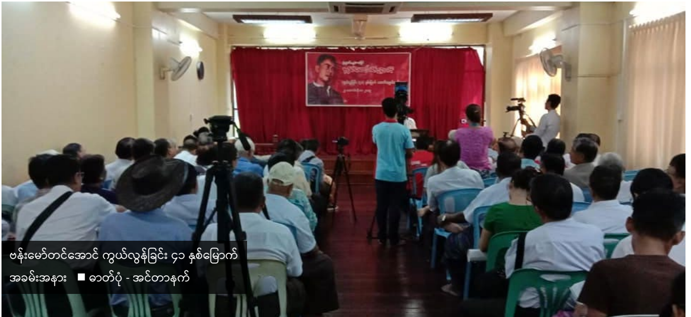
ဗန်းမော်တင်အောင် ကွယ်လွန်ခြင်း ၄၁ နှစ်မြောက် အခမ်းအနား ■ ဓာတ်ပုံ - အင်တာနက်

ဘဝကိုရင်ဆိုင်နိုင်မယ်။ ဘဝကို ဖြတ်သန်းနိုင်မယ် လို့ ယူဆတယ်။ ကိုတင်အောင်ဟာ အဲဒီအယူအဆ တွေ ရှိတယ်လို့ ကျွန်တော်ယူဆပါတယ်။အဲတော့ ကို တင်အောင်ရဲ့စာတွေမှာစကားလုံးအဆန်းတွေပါတယ် အသုံးအနှုန်း ဒါတွေအတွက် ကြိုက်တဲ့သူရှိတယ်။ ဝေဖန်တဲ့သူရှိတယ်။ ဘယ်လိုပဲပြောပြော ဩဇာအလွန် ကြီးမားတဲ့ စာပေ၊ ဝတ္ထုဖြစ်တယ်လို့ ပြောနိုင်ပါတယ်။ အဲဒီအတွက် တော်လှန်ရင်းနဲ့ နောက်ဆုံးကျတော့ ကို တင်အောင် ဟာ စာအများကြီးရေးပြီးတော့ လူတွေရဲ့ တော်လှန်ရေးစိတ်ကို နယ်ချဲ့ဆန့်ကျင်ရေး အာဏာရှင် တွေဖိနှိပ်လို့ ဒါတွေကို ဆန့်ကျင်တဲ့ဟာကို သူ့ရဲ့ ဘဝ ၊ သူ့ကိုယ်တိုင်ဖြတ်သန်းခဲ့တဲ့ ဘဝ ၊ သူ့ရဲ့ အတွေ့အကြုံ တွေ လို့ ပြောလိုရပါတယ်။ကိုတင်အောင် ရဲ့ နိုင်ငံရေး အယူအဆတွေ အများကြီးဖော်ပြနေသလို ဖြစ်ပါ တယ်။ ဒီဝတ္ထုကြီး အခု ပြန်ပြီးတော့လည်း ထွက်လာ ပါတယ်။ ကိုတင်အောင် ရေးဟန်တွေကို ကြိုက်တဲ့သူ ရှိမယ်၊ မကြိုက်တဲ့သူရှိမယ်။ ဒါပေမဲ့ အရေးကြီးတာ တခုက ကျန်ခဲ့တဲ့ ဒီဝတ္ထုကြီးကို ဖော်ပြတဲ့ ပရိတ်သက် သဘောထားအမြင်၊ နိုင်ငံရေး သဘောထား နိုင်ငံရေး အမြင် အယ်ဒီတာအဘော် အရေးကြီးတယ်လို့ မြင် ပါတယ်။ ဒါတွေနဲ့ ပတ်သက်ပြီးတော့ မိသားစုတွေ၊ မိတ်ဆွေအပေါင်းအသင်းတွေ သူ့ရဲ့ စာပေရဲဘော် အားလုံးကို တိုက်တွန်းချင်တာက ကိုတင်အောင်ရဲ့ စာတွေကိုပြန်ပြီးတော့ထုတ်နိုင်အောင် ကြိုးစားပါ