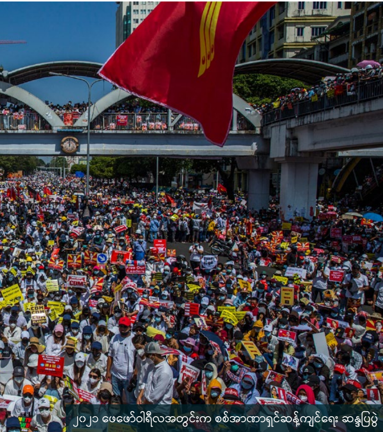
၂၀၂၁ ဖေဖော်ဝါရီလအတွင်းက စစ်အာဏာရှင်ဆန့်ကျင်ရေး ဆန္ဒပြပွဲ

ဆုံးခန်းတိုင် အောင်ပွဲရဖို့ မဟာမိတ်အင်အား အပြောင်းအလဲမျိုးစုံ မဟာမိတ်သဘောထားမျိုးစုံကို ဖြတ်သန်းလိုက်တော့မှ ခိုင်မာပြီး ရန်သူကိုဆုံးခန်းတိုင် တိုက်နိုင်တဲ့ တကယ့်မဟာမိတ်တွေရဲ့ တပ်ပေါင်းစုမျိုး ပေါ်ထွက်လာမှာဖြစ်လို့။ တပ်ပေါင်းစု ဒါမဟုတ် Joint Action ပူးတွဲလှုပ်ရှားဖော်ဆောင်ခြင်းရဲ့ သဘောတရားကိုယ်၌က ဘုံသဘောတူ ညီချက်နည်းနည်း လေးရရာကနေ တဖြည်းဖြည်း များများရလာအောင် လုပ်တာ၊ တဖြည်းဖြည်း ယုံကြည်မှုတည်ဆောက်တာ၊ တဖြည်းဖြည်းပိုမြင့်တဲ့ လက်တွဲလုပ်ဆောင်တာတွေ တက်လှမ်းကြရတဲ့ သဘော ဖြစ်လို့ တပ်ပေါင်းစုရပြီဆိုတာနဲ့ တစ်ခါထဲ ကိုယ်လိုချင်ရာပန်းတိုင်ကို မရောက်နိုင်ဘူး။