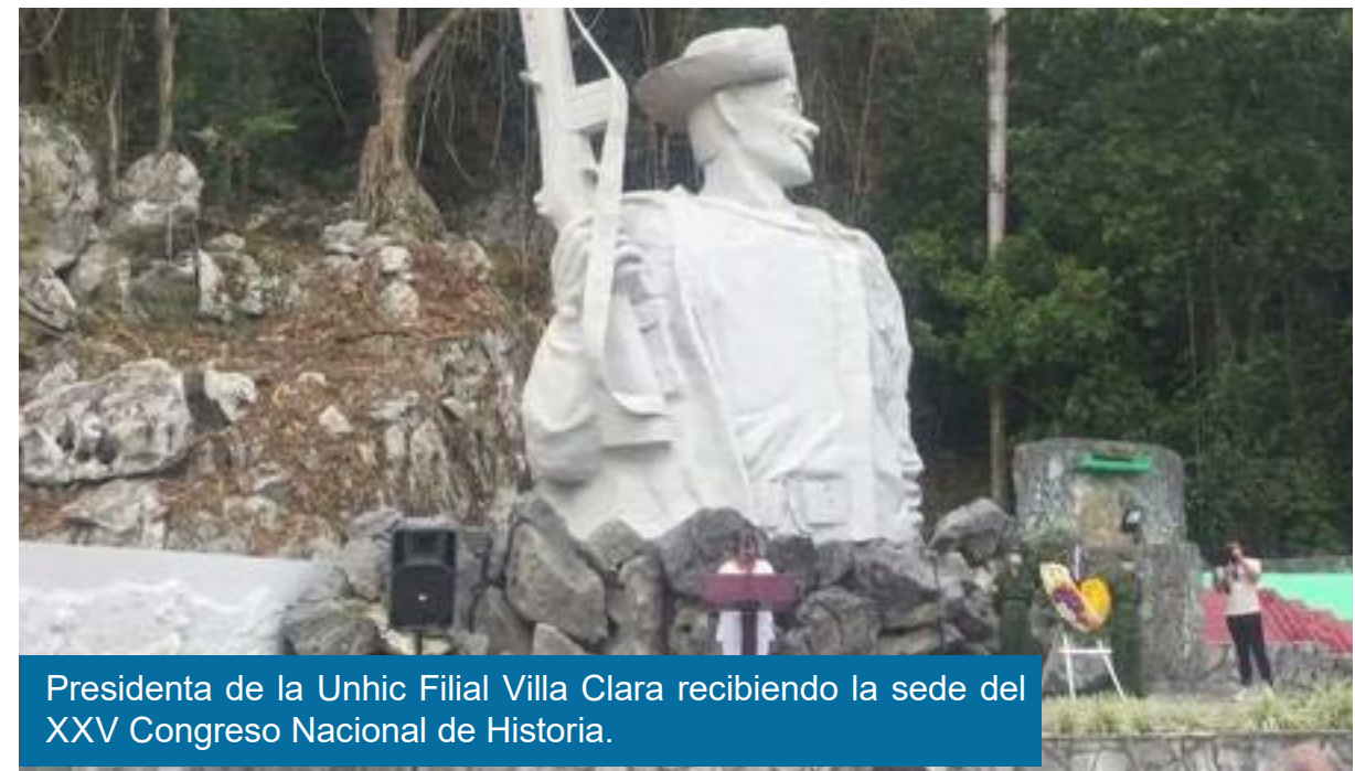
Presidenta de la Unhic Filial Villa Clara recibiendo la sede del XXV Congreso Nacional de Historia.

El XXV Congreso Nacional de Historia en Villa Clara será asumido con responsabilidad, compromiso revolucionario y dará continuidad a tan importante evento para el desarrollo de la investigación histórica en el país.